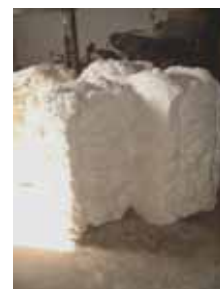
Fibre de coton biologique

Le Brésil est un grand producteur de coton mais la culture biologique et équitable en est à ses balbutiements. L'objectif est d'accompagner des producteurs dans leur conversion vers le biologique, en leur garantissant des débouchés, tout en les sensibilisant aux enjeux écologiques.