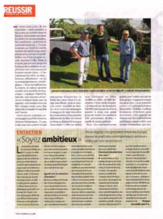
L'Express, 2 au 8 février : Ethique et cie dans sa rubrique Réussir

Nova : le 12 février dans son émission Neo Geo.