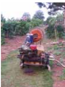
Epandeur manuel d'engrais biologique

Notre but : augmenter la production globale de coton biologique versus le coton traditionnel.