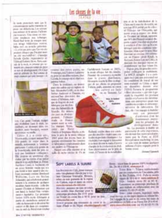
Le nouvel observateur, 19 au 25 janvier 2006